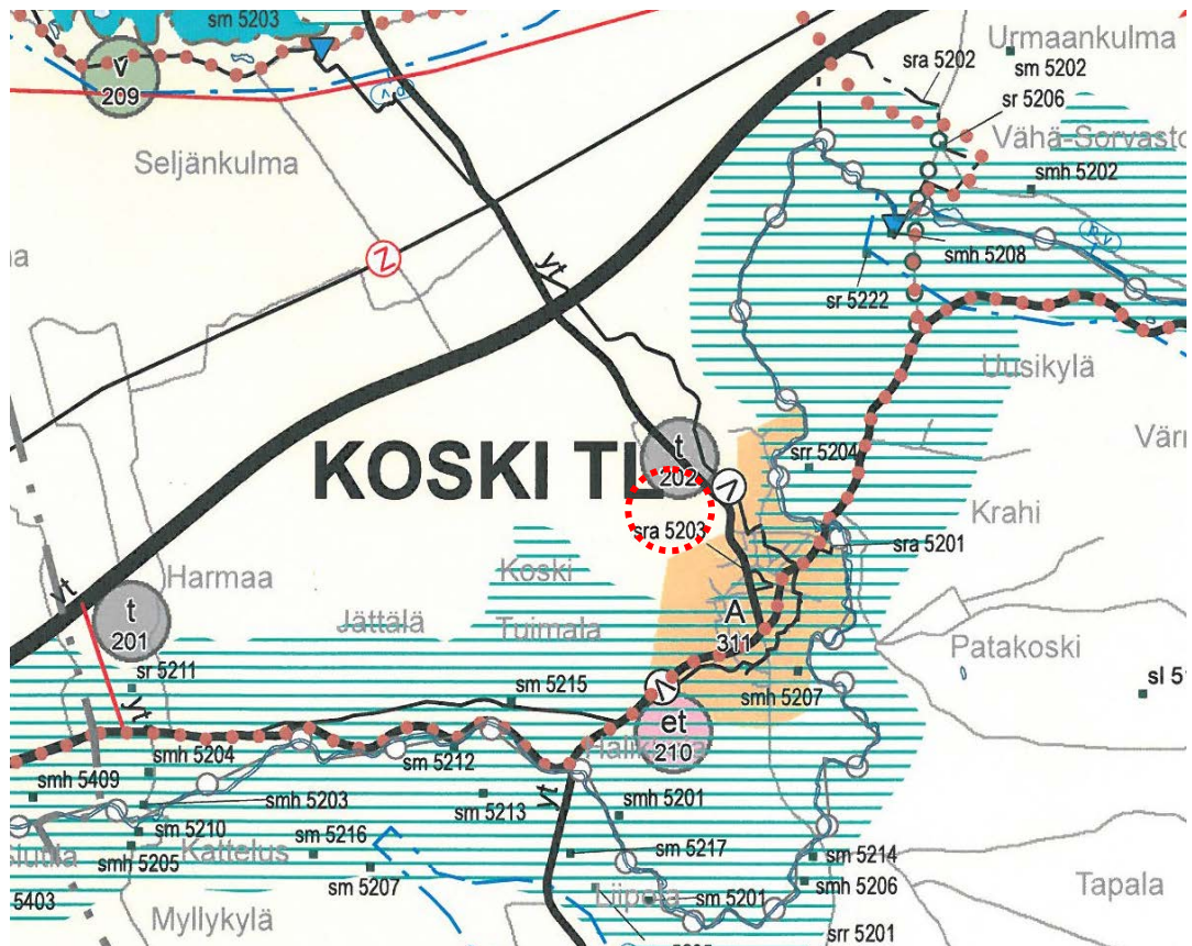
Ote maakuntakaavasta (suunnittelualue merkitty punaisella pisteiviivalla)

Alue on kulttuuriympäristön tai maiseman kannalta tärkeän alueen ulkopuolella.