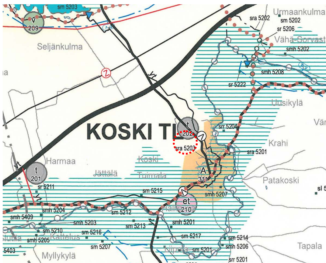
Ote maakuntakaavasta (suunnittelualue merkitty punaisella pisteiviivalla)

Alue on kulttuuriympäristön tai maiseman kannalta tärkeän alueen ulkopuolella.